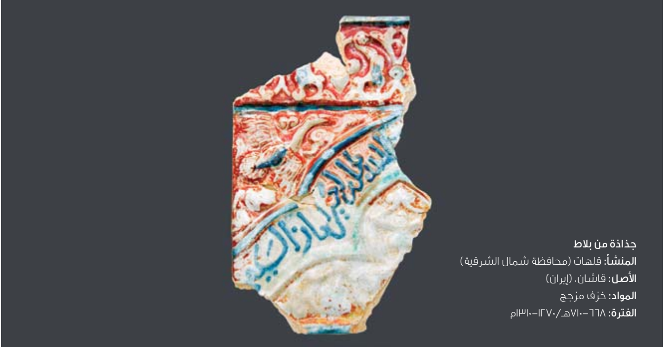
جذاعة من بلاط المنشأ: قلمات (محافظة شمال الشرقية) الأصل: قاشان، (إيران) المواد: خزف مزجج الفترة: ٦٦٨-٧١٠هـ/١٢٧٠-١٣١٠م