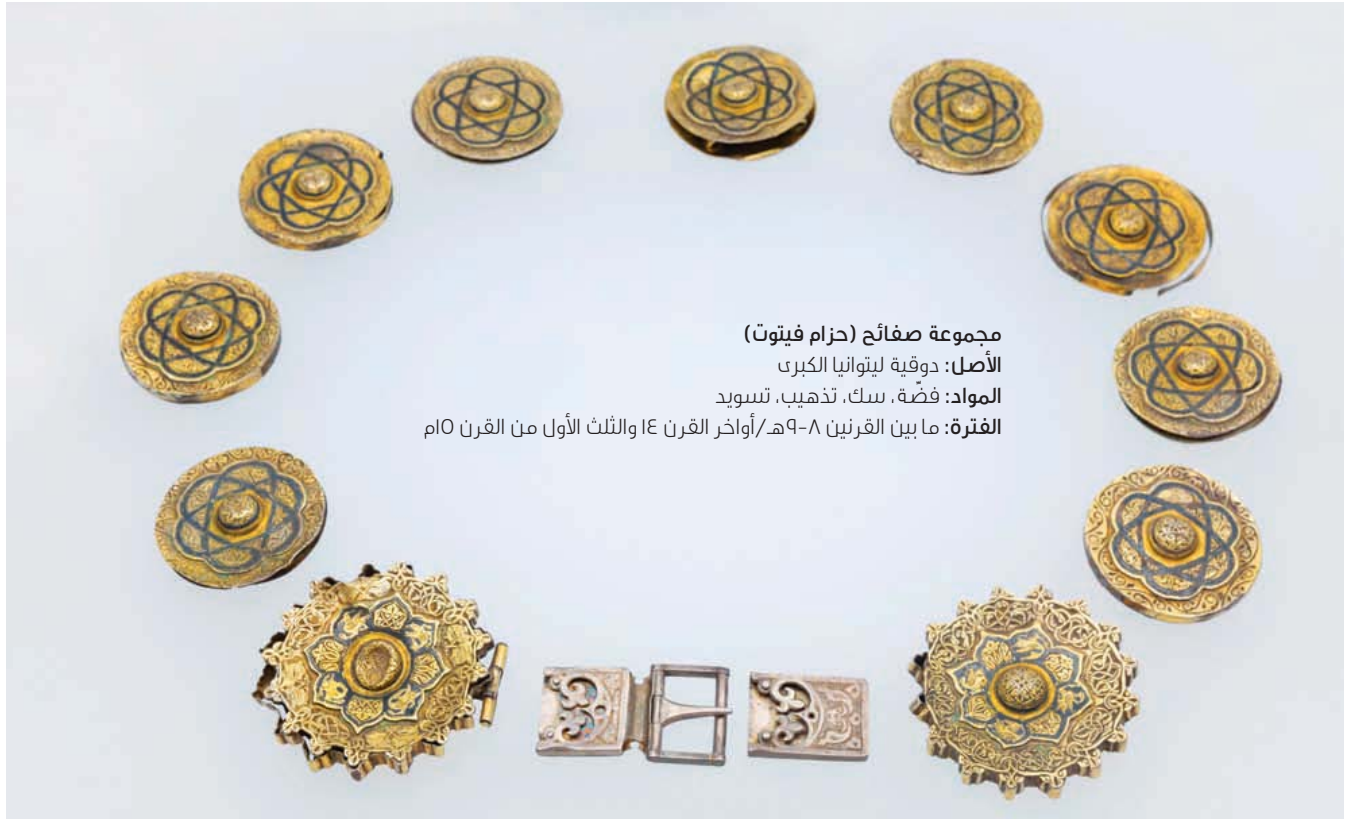
مجموعة صفائح (حزام فيتوت) الأصل: دوقية ليتوانيا الكبرى المواد: فضة، سبك، تذهيب، تسويد الفترة: ما بين القرنين ٨-٩هـ/أواخر القرن ١٤م والثالث الأول من القرن ١٠م

ومن بين المراحل ذات الأهمية أيضاً في تاريخ بيلاروس هي تلك الفترة التي توطدت فيها العلاقات بين دوقية ليتوانيا الكبرى وشعب التثار؛ فمن بين أبرز الكنوز وأكثرها قيمة هو ما يُسمى ”حزام فيتوت“ الذي يعود إلى أواخر القرن ١٤م/١٤م وتعود إلى القرن ١٠م، ومن المحتمل أن تكون هذه التحفة الفنية الإسلامية هدية من خان تثار القرم إلى الدوق (فيتوت) العظيم.