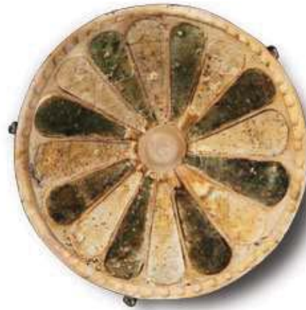
ميداليتان المنشأ: دبا (محافظة مسندم) المواد: صدف (مخروطي) التاريخ: ١,٢٠٠-٨٠٠ ق.م, (العصر الحديدي)