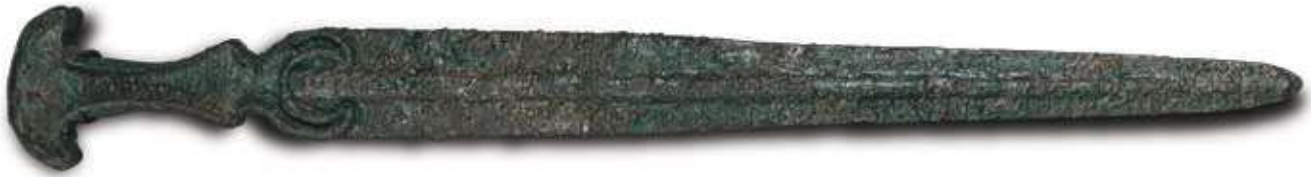
خنجران المنشأ: دبا (محافظة مسندم) المواد: برونز التاريخ: ١,٢٠٠-٨٠٠ ق.م, (العصر الحديدي)