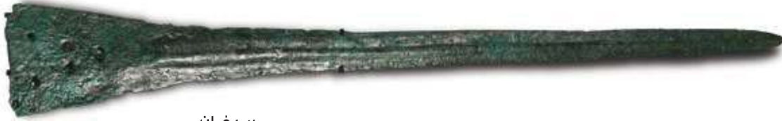
سيفان المنشأ: دبا (محافظة مسندم) المواد: برونز التاريخ: ١,٢٠٠-٨٠٠ ق.م, (العصر الحديدي)