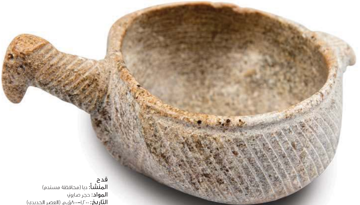
قدح المنشأ: دبا (محافظة مسندم) المواد: حجر صابوني التاريخ: ١٢٠٠-٨٠٠ ق.م. (العصر الحديدي)

ويتكوّن الكنز من آلاف اللقى الثمينة التي اكتشفت حديثًا في موقع مدفن جماعي في دبا على الطرف الشرقي لشبه جزيرة مسندم، ويبلغ طوله (٦٤,١٤) مترًا وعرضه (٣,٥) مترًا، ويحتوي على بقايا عظام (١٨٨) شخصًا على الأقل؛ وعثر بداخل المدفن وفي محيطه على أوان من البرونز، ومن الحجر الصابوني، وخناجر، وأساور، وخرز، ورؤوس سهام، وميداليات تعود إلى العصر الحديدي المبكر (حوالي ١٢٠٠-٣٠٠ ق.م.).