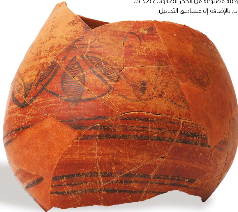
التقيب: رأس الجنز (محافظة جنوب الشرقية) المنشأ: حضارة وادي السند المواد: فخار مطلي الفترة: ٢,٥٠٠-٢,٠٠٠ ق.م. (العصر البرونزي الأوسط)

وقد عُثِر في هذه القرية على أقدم مبخرة (مجمر) في عُمان، كما أثبتت القطع التي اكتشفت في هذا الموقع، علاقة سكانها بدول ما وراء البحار؛ وذلك بما وُجد من قار، وأوعية فخارية تعود لبلاد الرافدين (العراق)، وجرار جلبت من وادي السند (الهند وباكستان)، وأوعية حجرية من بلوشستان وإيران، كما وجد أيضاً منتجات محلية معدة للتصدير؛ حيث وجدت أوعية مصنوعة من الحجر الصابوني، وأصداف، ولآلىء، وبعض المنتجات البحرية الأخرى، بالإضافة إلى مساحيق التجميل.